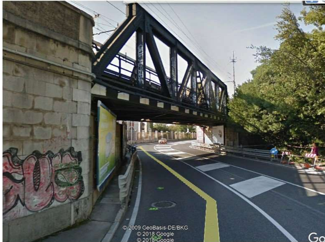
Cavalcavia ferroviario Railway overpass