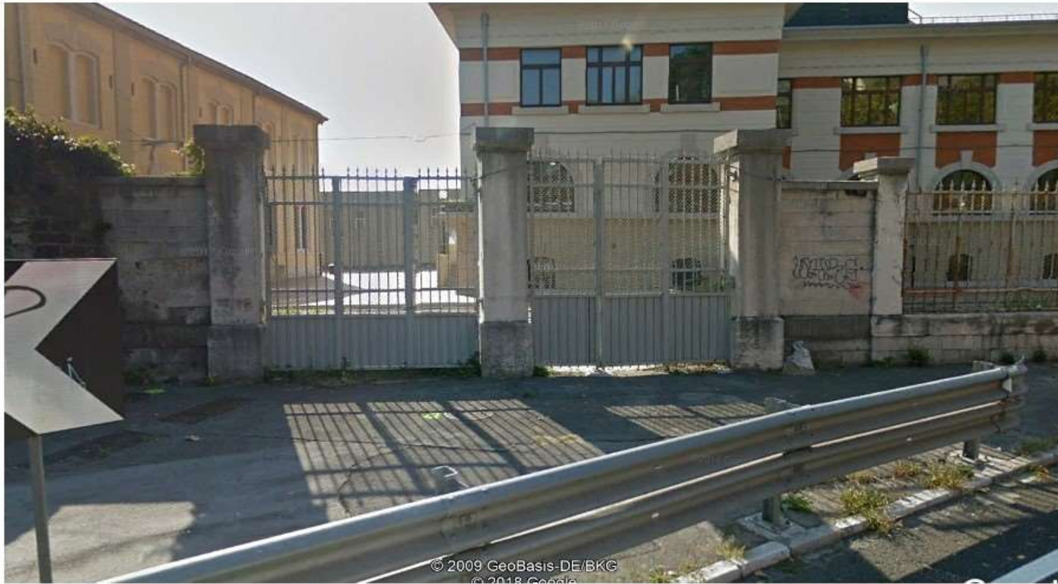
Cancello per pedoni Gate for pedestrians