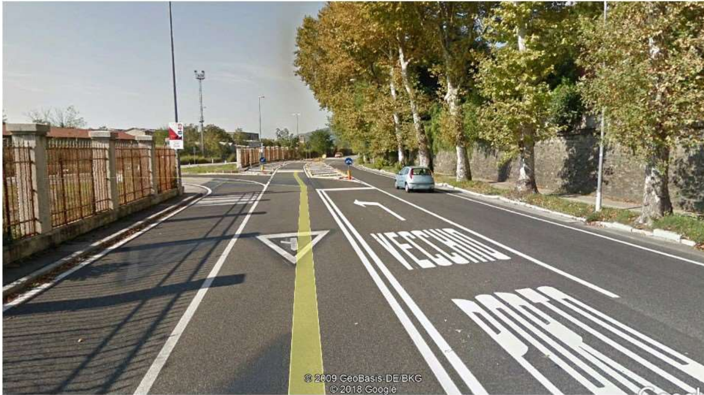
Svincolo per accesso auto Road junction for cars